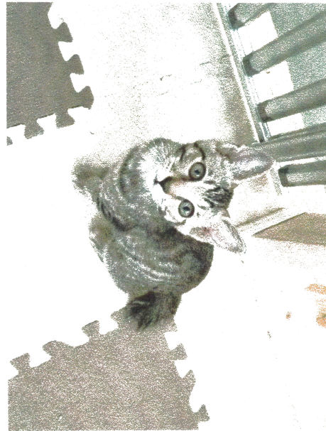
・シズ(オス) ・4か月 ・ワクチン2回目済、血液検査 陰性