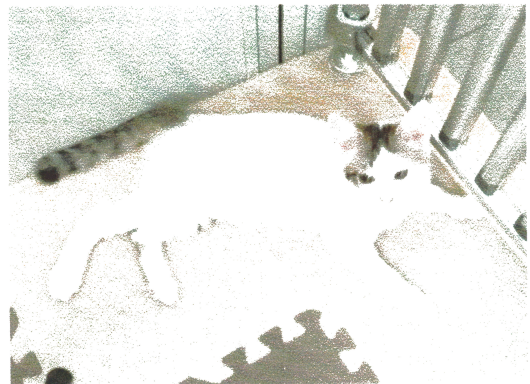
・ヤン(メス) ・4か月 ・ワクチン2回目済、血液検査 陰性